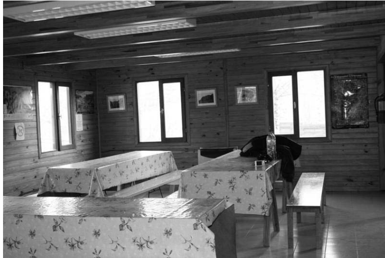
Figura 3. Área del futuro centro de visitantes