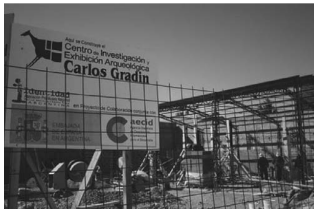
Figura 5. Obra del Museo Carlos Gradin

Gracias al aporte del subsidio de la AECID, fue posible iniciar el proyecto de la obra del Museo Carlos J. Gradin, que desde hace unos años la Asociación Identidad estaba gestando en esta localidad. Este lugar estará destinado a la exposición de material arqueológico y paleontológico, además contará con un laboratorio y depósito. Actualmente está en la última etapa constructiva. Aquí se expondrá el material arqueológico de las investigaciones de Carlos Gradin y su equipo en el Área del Río Pinturas, cumpliendo así con el deseo de este investigador de reintegrarlo a la comunidad local.