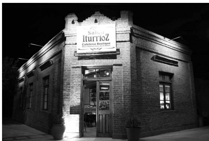
Figura 2. Salón Iturrioz. Sede de la Asociación Identidad

En este sentido, las acciones planteadas se vieron favorecidas por el evidente interés y el fuerte compromiso que siempre manifestó la comunidad de la localidad de Perito Moreno. En este proceso es fundamental el rol que cumple la Asociación Identidad Pro-Museo Regional en la organización y continuidad de las actividades que se llevaron a cabo. Esta asociación civil está conformada por un grupo de vecinos comprometidos con la historia del lugar e interesados en divulgar el patrimonio natural y cultural del área. Organizan distintos eventos culturales dirigidos a la comunidad y promueven la participación de estudiantes de distintos niveles educativos en actividades relacionadas con el patrimonio arqueológico, paleontológico, rural y urbano.