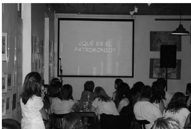
Figura 1. Taller a la comunidad de Perito Moreno

Como parte del trabajo estuvimos desarrollando una serie de actividades tales como: talleres de divulgación para la comunidad peritense, planificación de un centro de visitantes y mejoras en la infraestructura existente en el sitio para facilitar el acceso y circulación de turistas en el lugar.